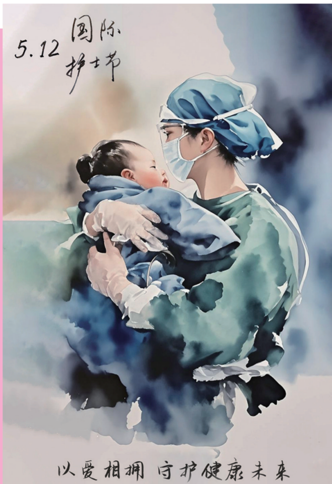
作品名:《定海神针 绽放光芒》 作者单位:广州医科大学附属第二医院 作者:肖艳霞 作品名:《以爱相拥 守护健康未来》 作者单位:江门市台山市人民医院 作者:黄素华 作品名:《关爱护士队伍 守护人民健康》 作者单位:东莞市常平镇社区卫生服务中心 作者:潘美娇