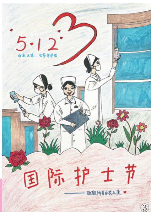
① 作品名:《最美护士》 作者单位:广州医科大学附属番禺中心医院 作者:陈桂婷 ② 作品名:《关爱护士 守护健康》 作者单位:南方医科大学南方医院 作者:曾嘉 ③ 作品名:《生命守护者》 作者单位:东莞市清溪医院 作者:周希 ④ 作品名:《凤凰花下的白衣天使》 作者单位:东莞市厚街医院 作者:刘嘉欣 ⑤ 作品名:《“护”佑生命 携手共进》 作者单位:广州医科大学附属第二医院 作者:陈琼琼