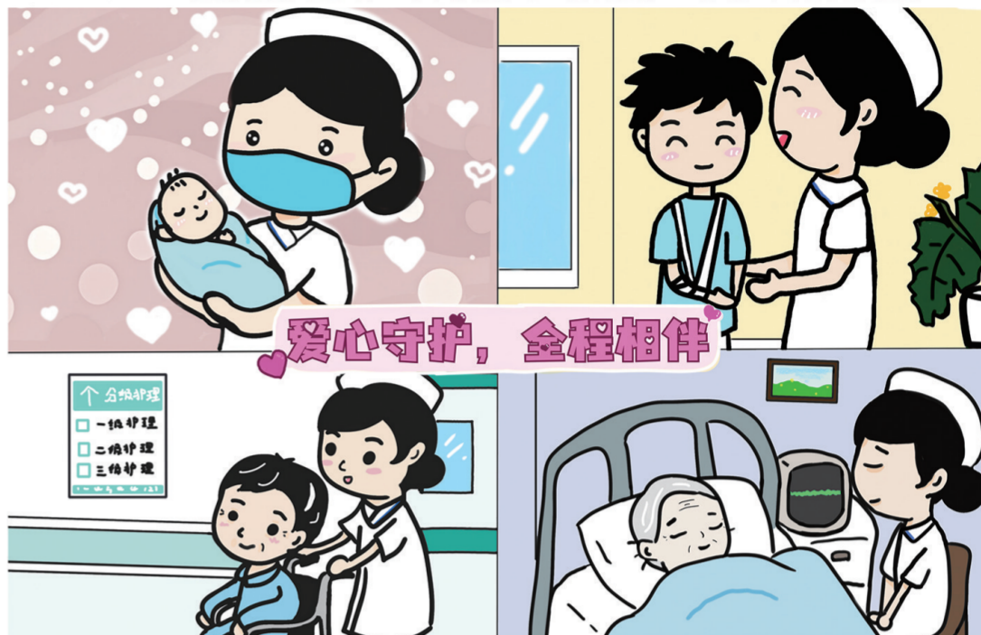
▲ 作品名:《爱心守护 全程相伴》 作者单位:东莞市人民医院 作者:陈雪欣 刘芷颖

编者按： 一袭白衣，托起生命的重量；一盏提灯，照亮健康的归途。护士，是患者暗夜里的暖光，是病房中最温柔的守护者，更是用专业与仁心织就人间温情的平凡英雄。 今年的5月12日是第114个国际护士节，我国护士节主题为“关爱护士队伍，守护人民健康”。为了进一步弘扬护理职业精神，在全社会营造尊医重卫的良好氛围，广东省卫生健康委在全省范围内征集了2025年5·12国际护士节宣传公益海报，本期特别以征集的部分手绘作品为载体，向大家展示画笔勾勒出的深夜值班室暖光，水彩晕染出口罩下的笑颜，共同感受“三分治疗，七分护理”的温暖，以此向所有护理工作同仁致以崇高的敬意！ (刘欣)